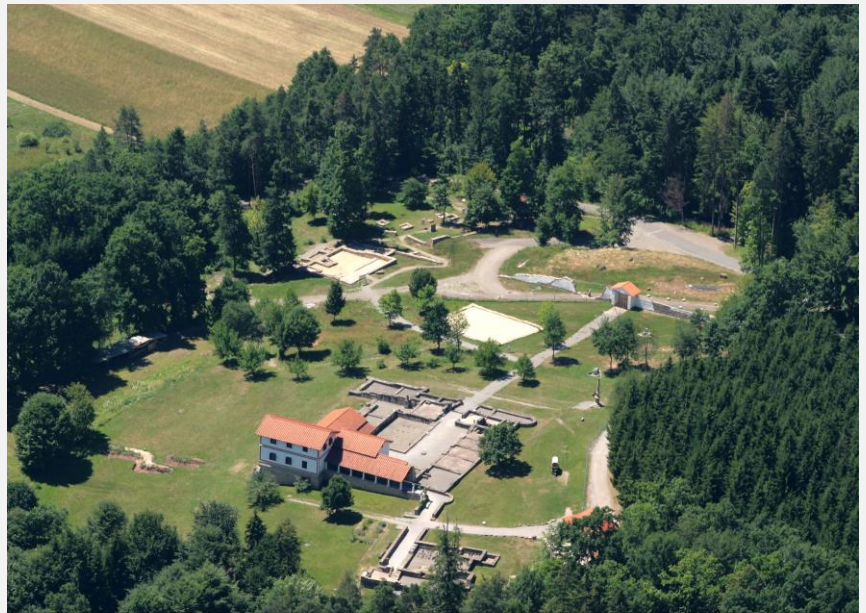
B1 Luftbild – Gesamtanlage des Freilichtmuseums

Weitere Tipps erhältst du bei Bedarf von deinem Lehrer!